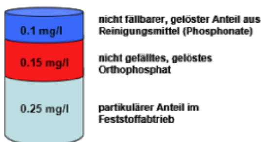
Abb. 1: Fraktionierung des Gesamt-P-Gehalts im Ablauf (Böhler und Siegrist) 1

Eine naheliegende Lösung scheint zunächst die Erhöhung des Fällmitteleinsatzes zu sein. Dies ist jedoch nicht nur teuer, sondern vielfach auch von begrenzten Erfolgsaussichten: Neben dem fällbaren Orthophosphat enthält der Ablauf einer Kläranlage oft noch Anteile an nicht fällbaren Phosphonaten sowie erhebliche Mengen partikulären Phosphors im Flockenabtrieb.